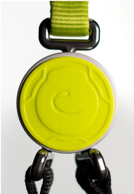
Beispiel für eine Kunststoffschale ohne Prägung

Sets der betroffenen Chargen, die von uns bereits überprüft wurden, sind daran erkennbar, dass sich, wie unten abgebildet, auf einer der Kunststoffschalen ein geprägter Kreis um das Logo „e“ befindet. Ungeprüfte oder nicht betroffene Sets weisen solch eine Prägung auf keiner der beiden Kunststoffschalen auf.