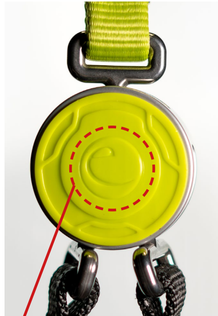
Beispiel für eine geprägte Kunststoffschale eines mangelfreien, durch uns bereits geprüften Sets

Bitte schicken Sie Ihr Klettersteigset zeitnah an EDELRID zurück.